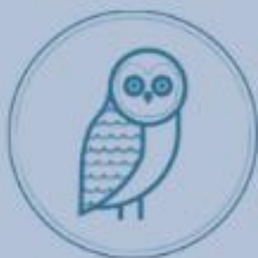
House of Education - Sapere Aude